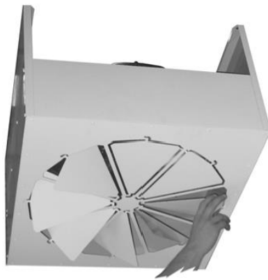
2. Állítsa be a terelőlemezeket a kívánt kifúvási szögnek megfelelően.