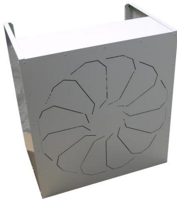
1. Zárt terelőlemezek

A felszerelés után állítsa be a terelőlemezeket. Eközben a ventilátor nem működhet!